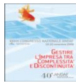
Costa Crociere 2008